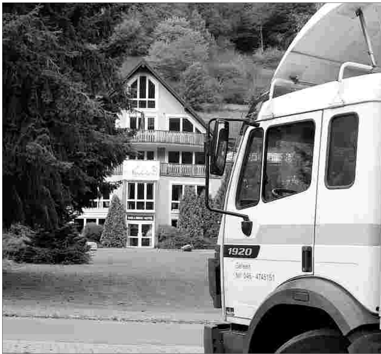
Der Möbelwagen steht schon vor dem Haus: Bald werden niederländische Betreiber das Wellnesshotel in Erkersruhr wiedereröffnen, das dann den Namen „Eifelgold Rooding“ trägt.