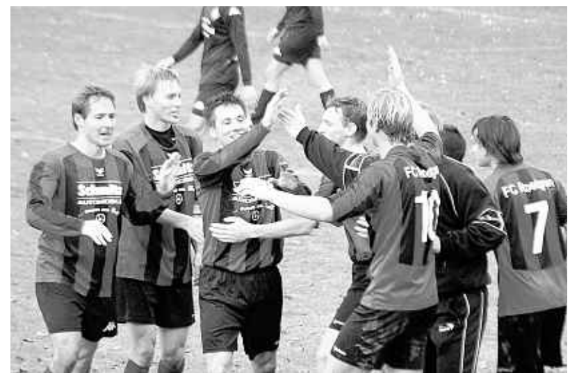
Eicherscheid – Roetgen 3:4: In einem torreichen und emotionsgeladenen Derby hatten die Gäste das bessere Ende für sich. Hier der Schwarz-Rote Jubel nach dem Siegtreffer für die Gäste.

Leider gab es für den Trainer nach dem Spiel nichts mehr zu feiern, denn da erfuhr er, dass während des Spiels bei ihm zu Hause eingebrochen wurde. (kk)