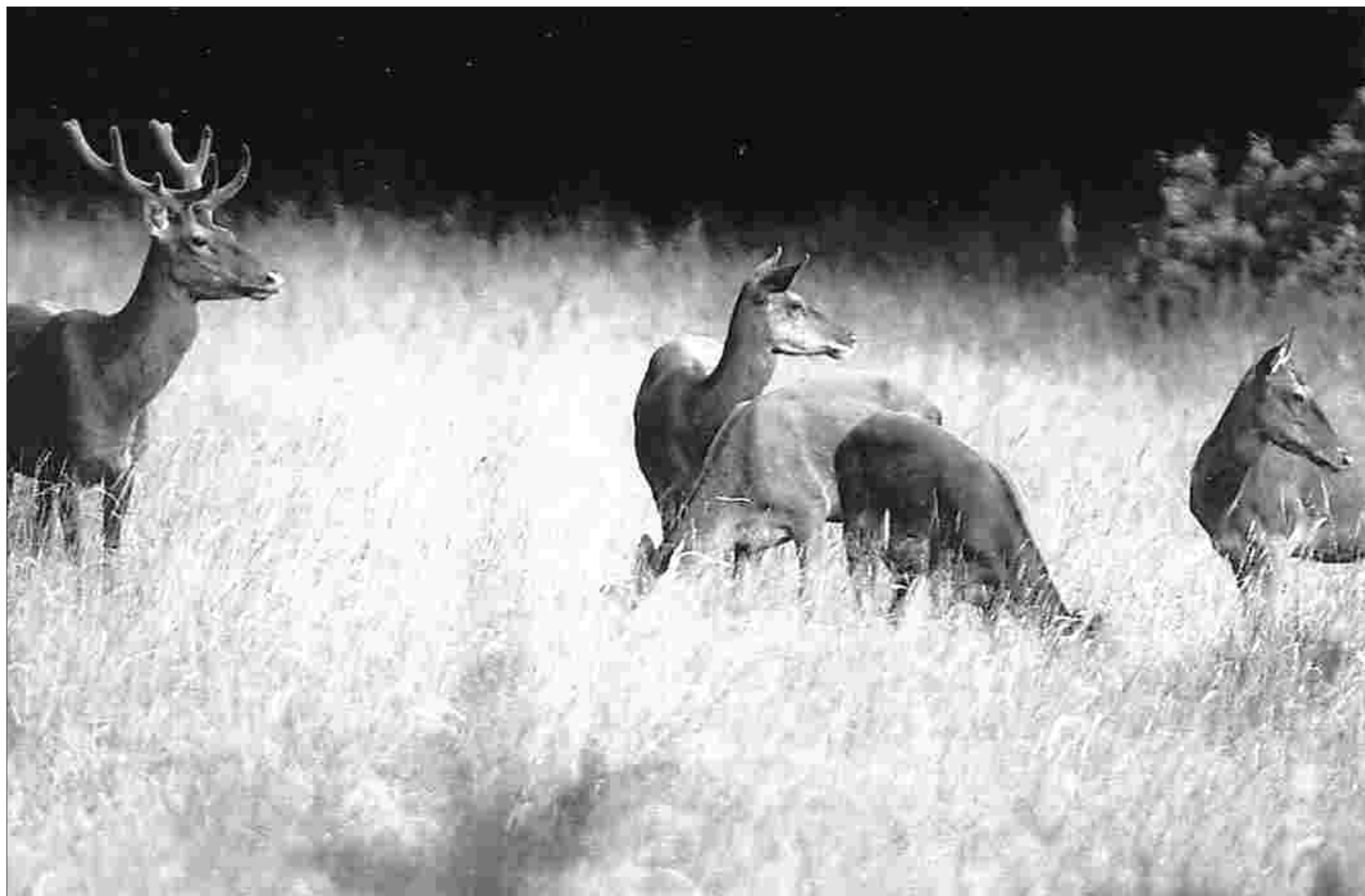
Am Freitag, 18. Januar, veranstaltet das Nationalparkforstamt Eifel einen kostenfreien Info-Abend zum Thema „Tagvertrautes Rotwild“.

► Wenn die natürlichen oder naturnahen Ökosysteme im Nationalpark oder die Maßnahmen zu deren Entwicklung auf großer Fläche in einem Umfang durch Wildverbiss beeinträchtigt werden, der mit dem Schutzzweck nicht zu vereinbaren ist.