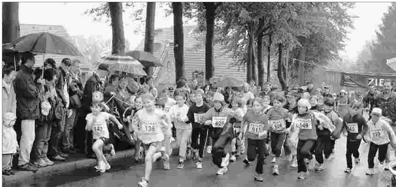
Auf die Plätze, fertig, los: Beim Mützenicher Vennlauf kommen nicht nur die Läufer, sondern auch Wanderer und Walker auf ihre Kosten.