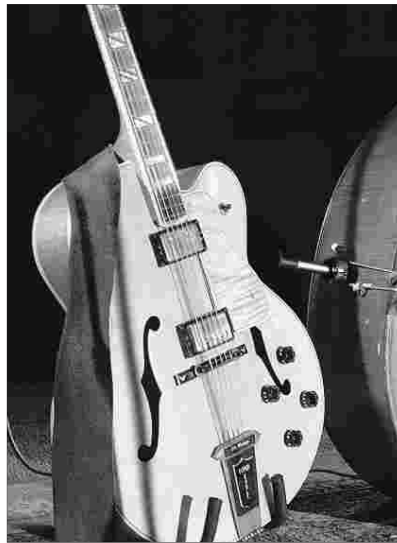
Die Freunde des Jazz kommen in Juni wieder auf ihre Kosten. Bereits zum sechsten Mal finden die Monschauer Jazz-Tage statt.