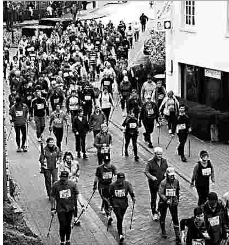
Zum Auftakt des Rursee-Marathons gingen rund 200 Walker an den Start und marschierten – immer mit Blick auf den See – eine 16,5 Kilometer lange Strecke durch die herbstliche Eifelnatur.

Für Erholung und Unterhaltung im Festzelt hatte das Organisationsteam des Rursee-Marathons bestens gesorgt: Während ver-