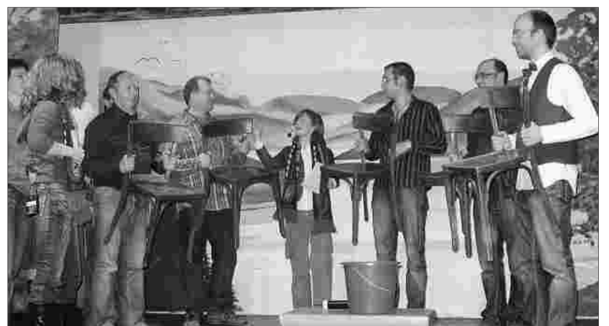
Der Vorstand des Konzener Musikvereins hatte beim „Stuhlgang“ die Lacher auf seiner Seite.