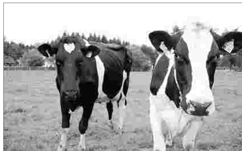
Vom Protest der Milchbauern merken die Kühe nichts: Sie grasen weiter wie gewohnt und werden zweimal täglich gemolken.