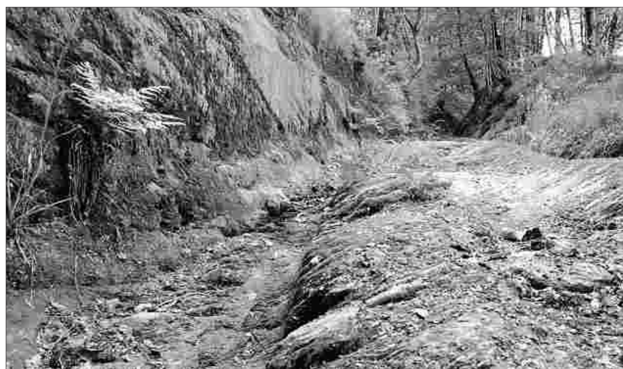
Beim Lammersdorfer Dorfrundgang darf auch der historische Hohlweg am Kelzerbach nicht fehlen, wo noch gut die ins Felsgestein eingekerbten Karrenspuren zu erkennen ist.