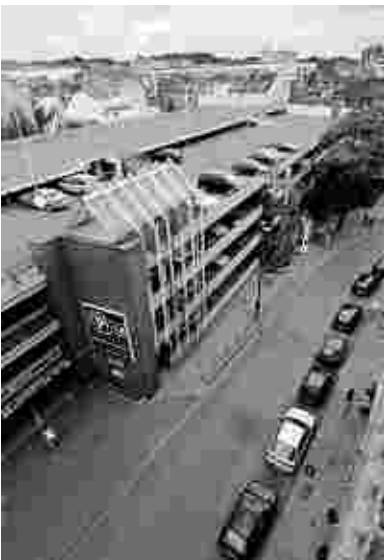
Jetzt soll es flott gehen: Das Parkhaus Büchel wird an den Bauriesen Strabag verkauft. Der baut das, was als „Trendboxx“ bekannt war.

Was aber bleibt, ist die markante Architektur inklusive Parkhaus mit 137 (bisher 600) Stellplätzen. Auch da Freude bei der Apag, denn sie darf es weiterhin betreiben. Beim Innenleben wird sich einiges ändern, wie Schäfer erklärt. Beim