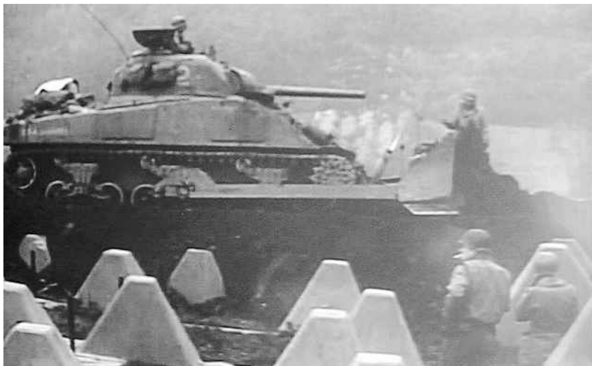
Der Westwall ist ein heute noch erhaltener Zeuge einer grausamen Epoche der regionalen Zeitgeschichte.

ihrer Internetseite ein nach Datum gegliedertes, historisches Kalenderblatt über die Ereignisse in der Region Aachen-Düren-Nordeifel veröffentlichen, aus dem jeder Interessierte kostenlos die gewünschten Informationen beziehen kann. Bei der Recherche für neue Publikationen werden wir dann auf die Vereine und Zeitzeugen in den Dörfern zugehen. (hth)