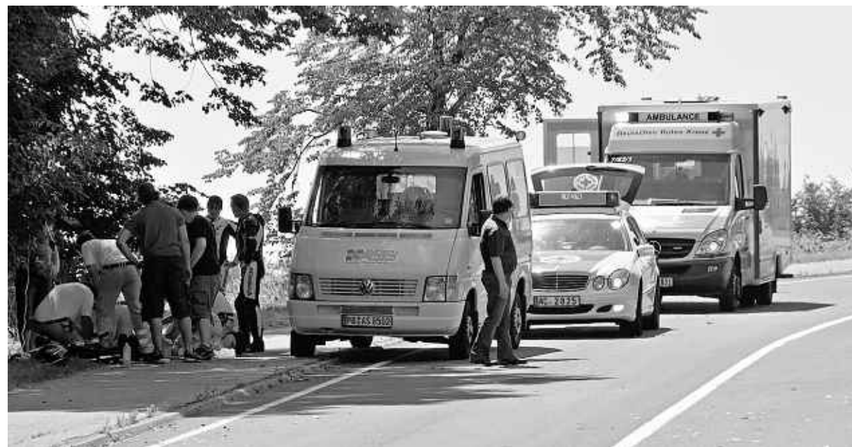
Notarzt und Rettungssanitäter kümmerten sich vor Ort um den verunglückten Motorradfahrer. Doch für den 29-Jährigen kam jede Hilfe zu spät.

Lokalredaktion: Matthias-Offermann-Straße 3, 52156 Monschau-Imgenbroich, Tel. 02472/9700-30, Fax 02472/9700-49. e-Mail: lokales-eifel@zeitungsverlag-aachen.de Peter Stollenwerk (verantwortlich), Heiner Schepp, Ernst Schneiders. Leserservice: 0180 1001 400 Servicestelle: 3 Plus/Bürobedarf Kogel: Hauptstraße 17, 52152 Simmerath, Öffnungszeiten: Mo. bis Fr. 7.30 bis 18.30 Uhr, Sa. 7.30 bis 13.00 Uhr.