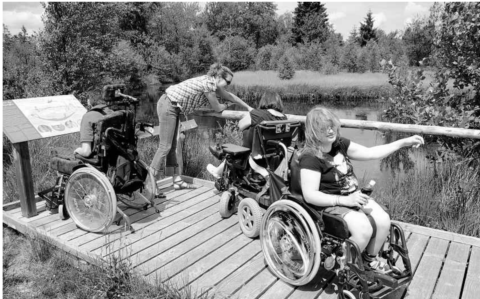
Von Behinderten getestet und für gut befunden: Mitarbeiter und Bewohner des Helena Stollenwerk-Hauses aus Simmerath auf dem neu angelegten barrierefreien Rundweg durch das Rote Venn bei Mützenich.

Weiter führt der Weg dann zum acht Meter hohen Aussichtsturm, der zwar nicht barrierefrei ist, aber dafür wurde in direkter Nähe des Turms ein Ruheplatz eingerichtet,