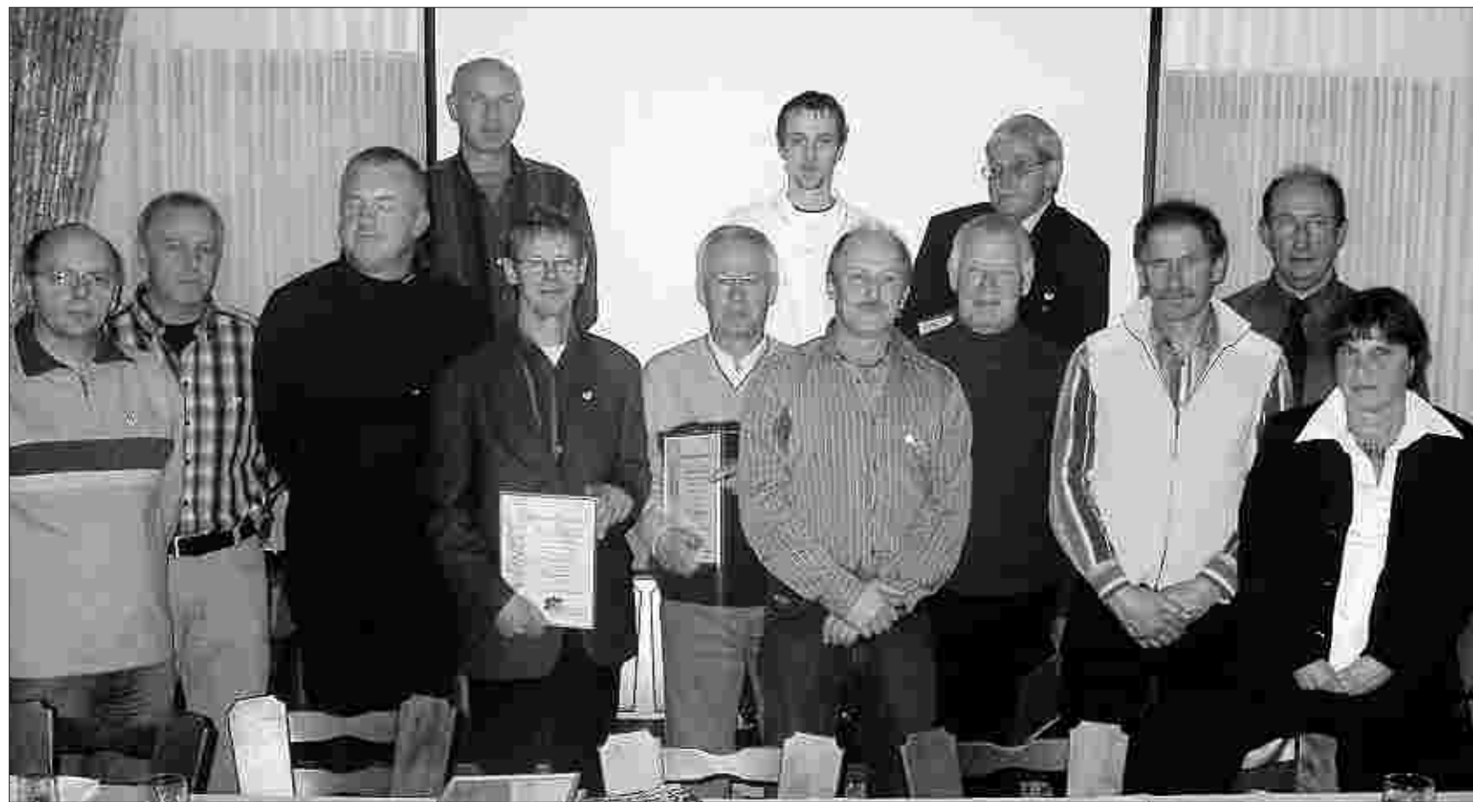
Der TV Konzen ehrte bei seiner Generalversammlung zahlreiche Mitglieder für 25-jährige bzw. 50-jährige Treue zum Turnverein.