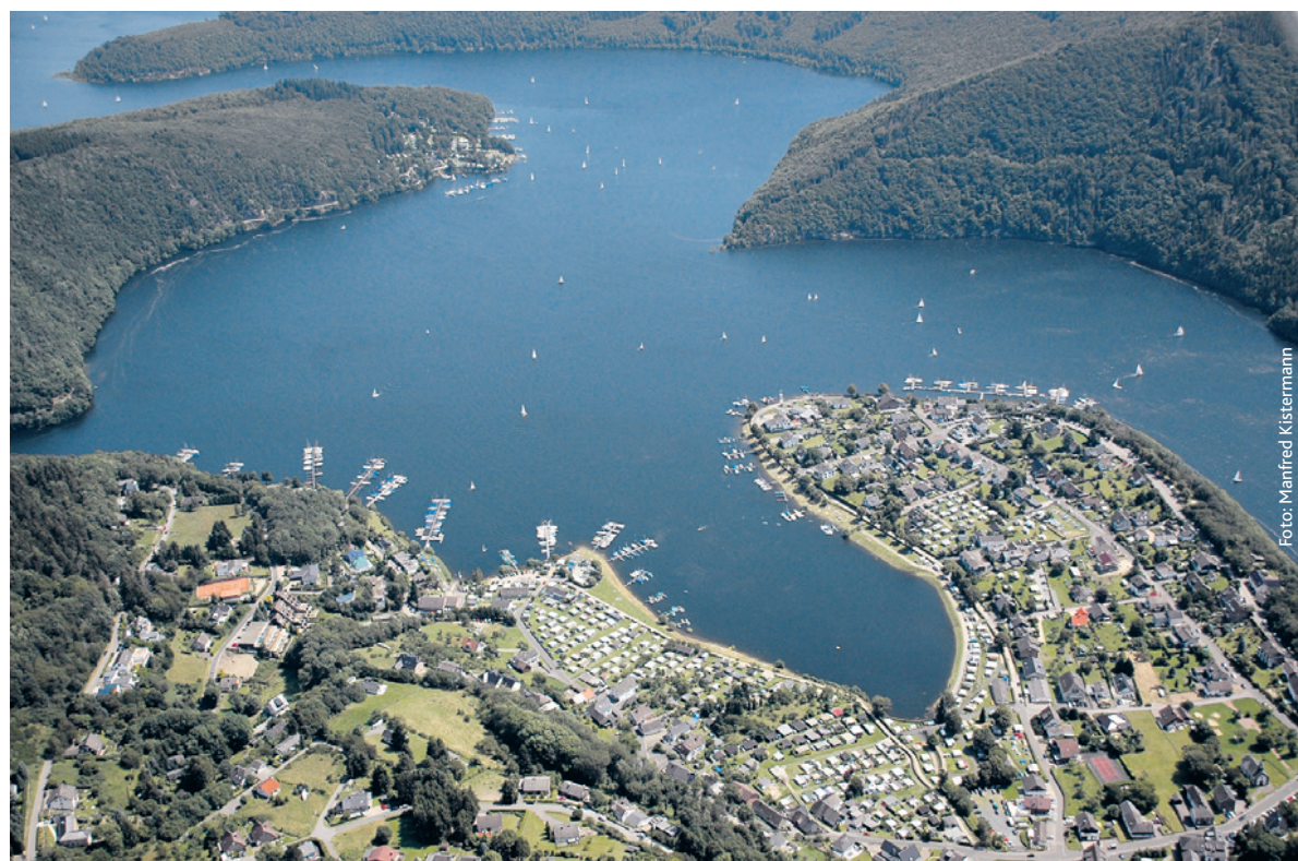
Woffelsbach am Rursee, möglicher Standort eines 700 Millionen Euro teuren Pumpspeicherkraftwerks.