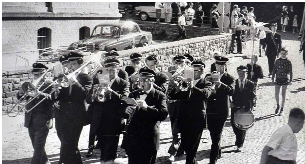
Die Musikvereinigung vor rund 50 Jahren beim Kirmesumzug auf der Aubrücke. Wann genau dieses Foto aus dem Archiv von Manfred Brandenburg entstanden ist, ist nicht bekannt, könnten aber Zeitzeugen wissen.

Die bereits 31. Musikwoche in Monschau beginnt am heutigen Donnerstag, 14. Juli, mit einer Straßenparade der Arnheband aus den Niederlanden in der Altstadt. Nach der offiziellen Eröffnung werden dann noch die gastgebende Musikvereinigung und die Eifelklänge aus Eicherscheid auf dem Markt zu hören und sehen sein.