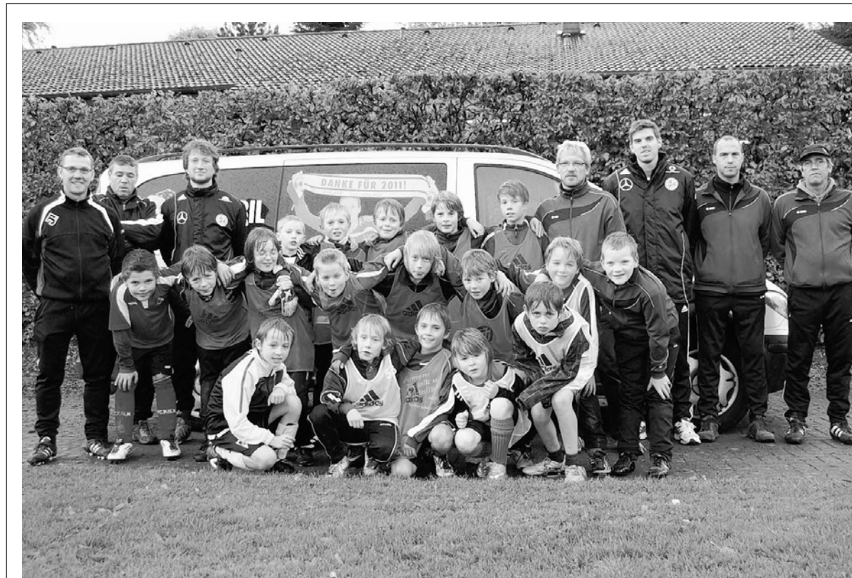
Das DFB-Mobil fuhr beim SV Roland Rollesbroich vor

Gegen den Stolberger Fahrer wurde ein Ermittlungsverfahren eingeleitet.