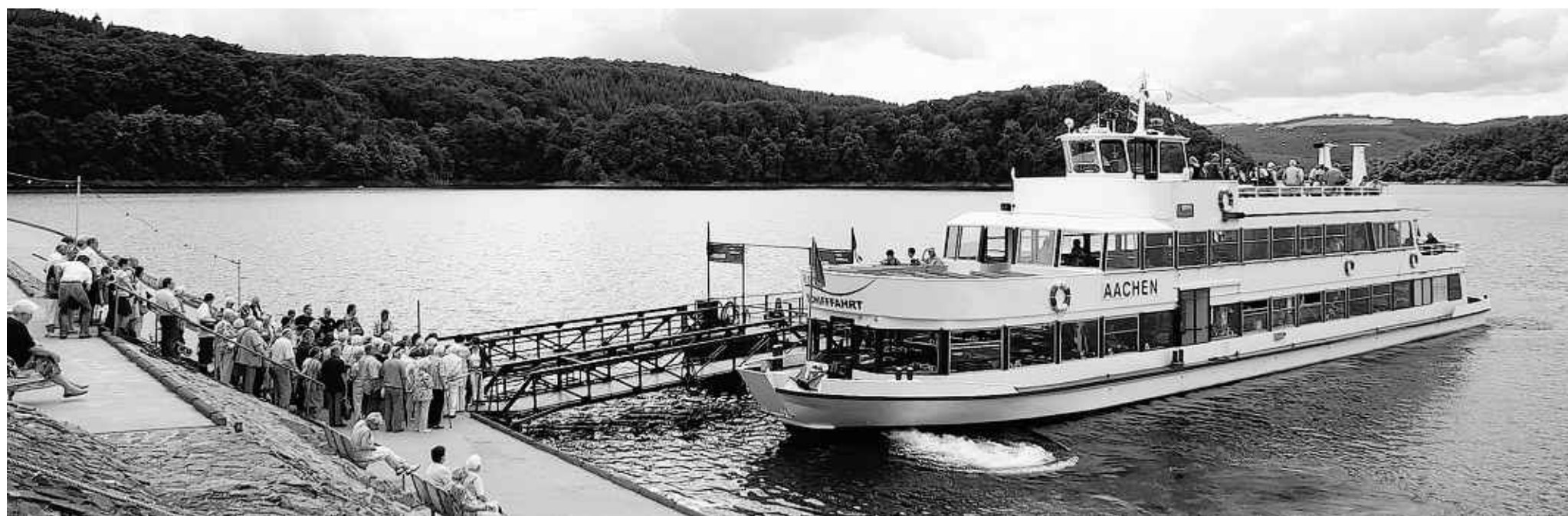
Im Sommer ein beliebtes Ausflugsziel: Jedes Jahr lassen sich Tausende Menschen mit dem Schiff über den Rursee fahren.

Roetgen. Ein 18-jähriger Autofahrer hatte am Mittwoch gegen 17.30 Uhr auf der Bundesstraße einen Rückstau zu spät erkannt und prallte dann auf das letzte in der Schlange stehende Fahrzeug. Dadurch wurden der nächste und übernächste Pkw angestoßen. An den vier beteiligten Autos entstand ein Sachschaden von 4 700 Euro. Zwei Fahrzeugführer erlitten leichte Verletzungen.