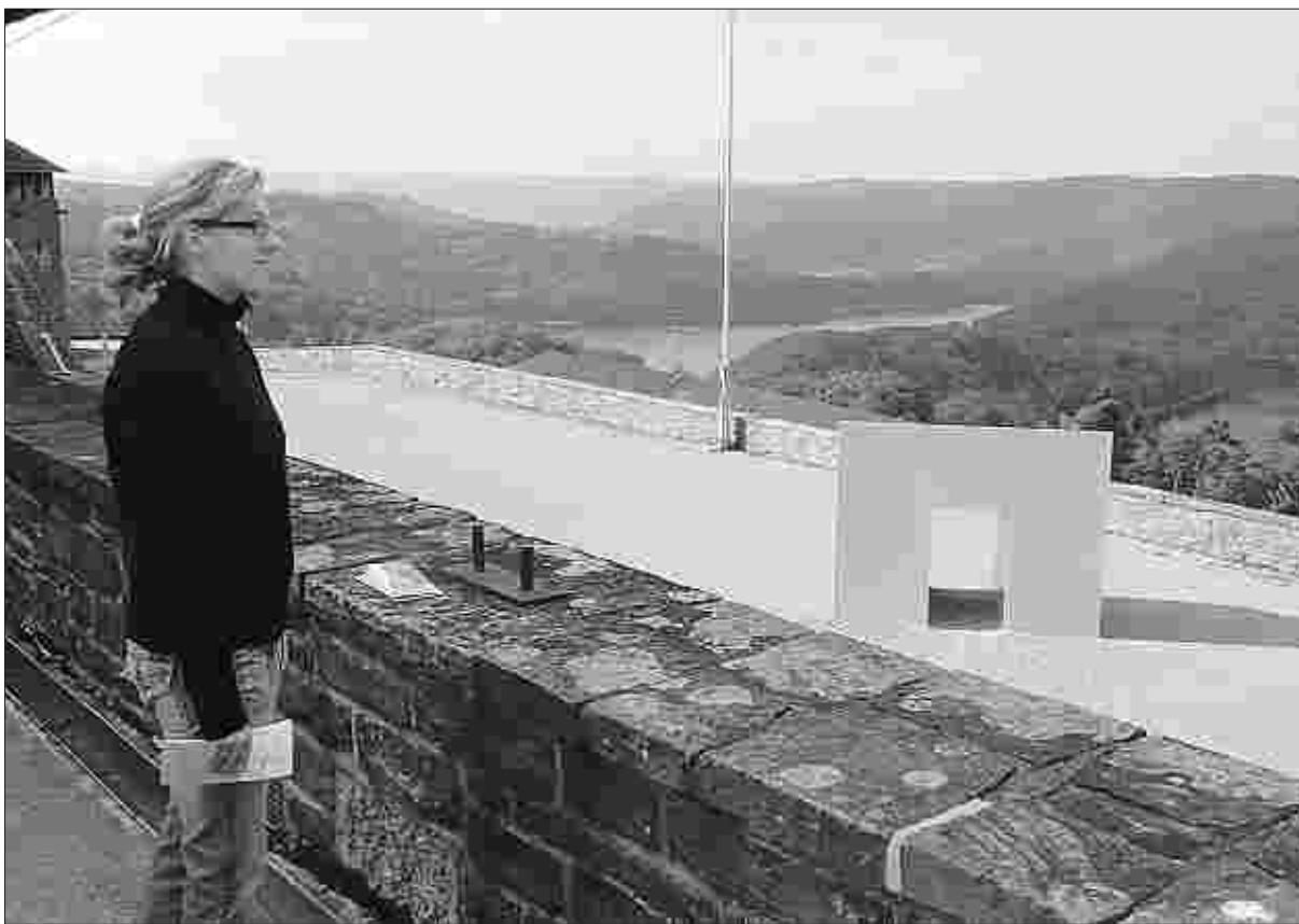
Darf nicht fehlen: Die Besichtigung der ehemaligen Ordensburg Vogelsang, in der sich heute ein Informationszentrum befindet, gehört zur Tour in den Nationalpark Eifel.

Dort erhält man auch weitere Infos zur Kindertheaterreihe, die im Dezember mit einer Weihnachtsgeschichte die diesjährige Theaterspielzeit abrundet.