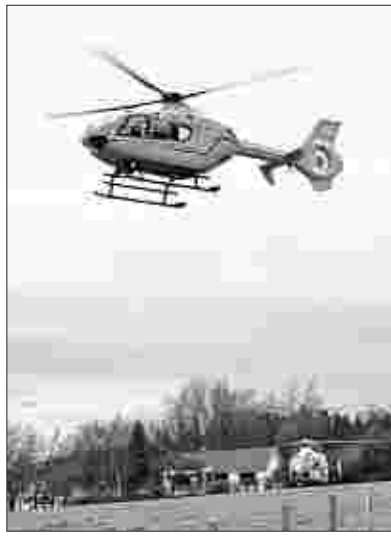
Rettungshubschrauber brachten die Unfallopfer binnen zehn Minuten in die Unikliniken Köln und Bonn.