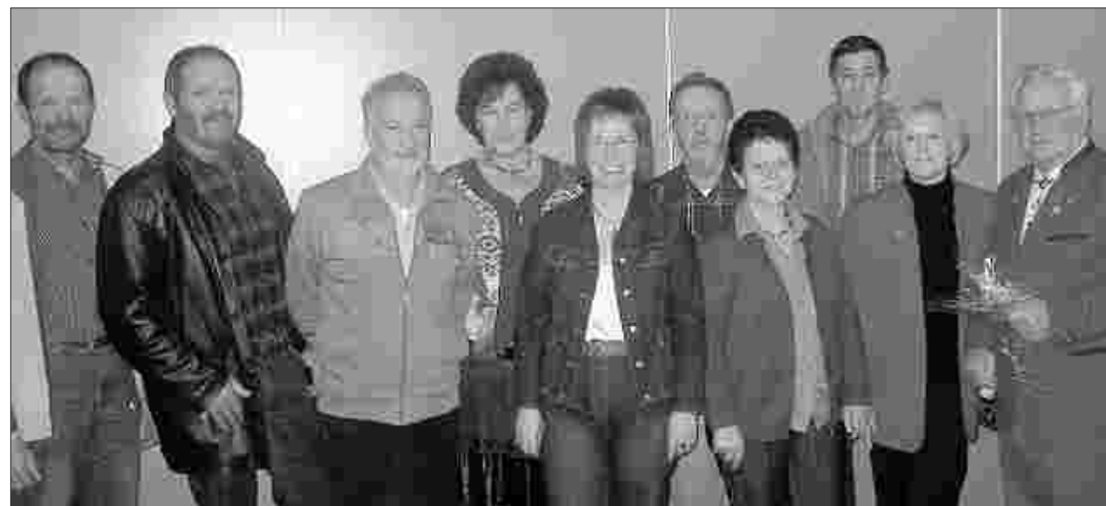
Vorstandsneuwahlen und Ehrungen verdienter Mitglieder bestimmten die Themen der Hauptversammlung beim Eicherscheider Eifelverein.