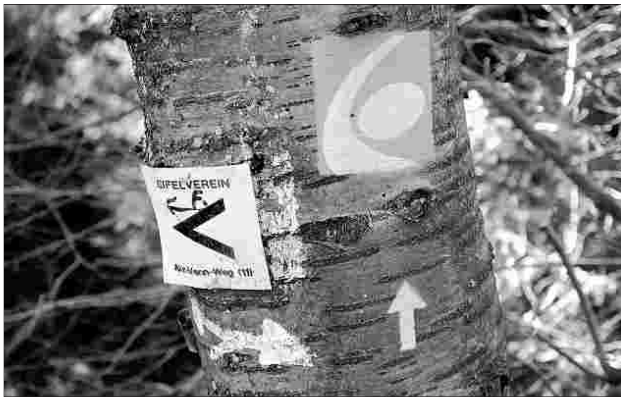
Eine dauerhafte und einwandfreie Markierung des Eifelsteigs ist keine Kleinigkeit. Ab 1. April übernimmt der Eifelverein in Form von Wegepatenschaften diese Aufgabe.

Während kleinere Ausbesserungsarbeiten wie das Anbringen von neuen Zwischenmarkierungsschildern selbst vom Wegepaten erledigt werden können, muss der