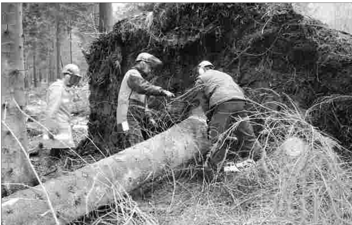
Praxis wurde beim Lehrgang Technische Hilfe Wald groß geschrieben. Unter wirklichkeitsnahen Bedingungen mussten Windbrüche im Stadtwald aufgearbeitet werden.

Die 18 Prüfungskandidaten des letzten Lehrganges bestanden alle