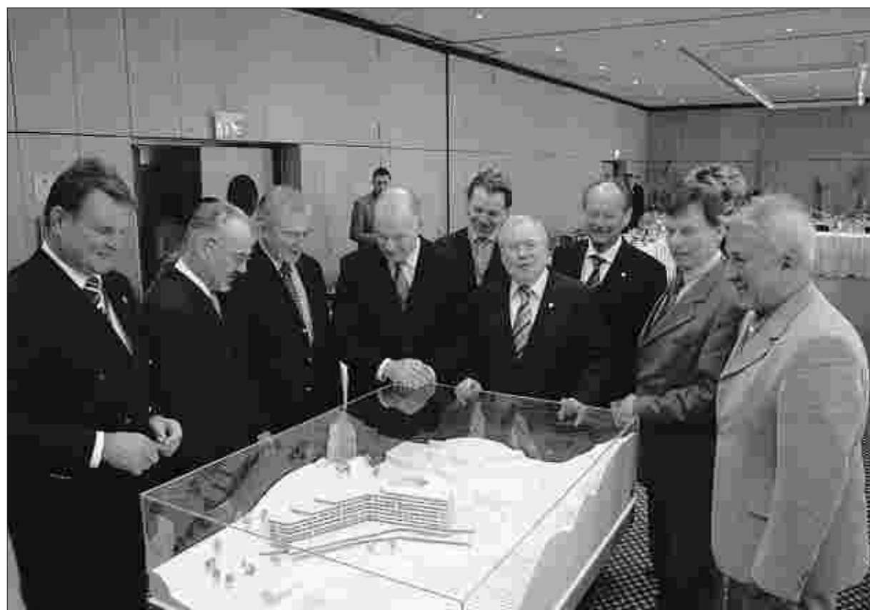
Am Rande der ITB in Berlin stellte die Stadt Monschau mit den Investoren auch das geplante Hotel-Projekt im Rosenthal vor. Es wurden auch neue Kontakte zu möglichen Betreibern geknüpft.

Die aktuellen Zahlen zeigen, dass die Tourismus-Region Eifel in der Tat im Aufschwung ist. Helmut Etschenberg spricht von einem Gesamtumsatz in der Region durch den Tourismus von rund 1,25 Milliarden Euro, 50 000 Beschäftigte arbeiten im Beherbergungs- und Gastgewerbe sowie in den beteiligten Bereichen der Wirtschaft. In über 2000 Betrieben stehen nicht weniger als 47 000 Betten zur Verfügung mit über 4,5 Millionen Übernachtungen. Betrachte man den gesamten Bereich zwischen Aachen und Ahrtal, dann komme man auf etwa 70 Millionen Tagesgäste, davon immerhin noch 46 Millionen im Bereich der Eifel-Tourismus GmbH. Als gemeinsames Dach betrachtet Etschenberg die Zukunftsiniti-