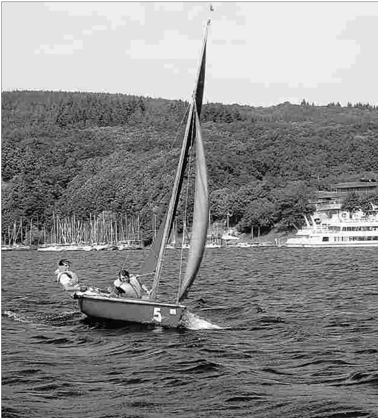
So macht Segeln auf dem Rursee Spaß: In einer Woche kann man den Umgang mit Jolle oder Pirat erlernen.

Auch der Segelsport hat sich, ähnlich wie Tennis und Golf, in den vergangenen Jahren einem