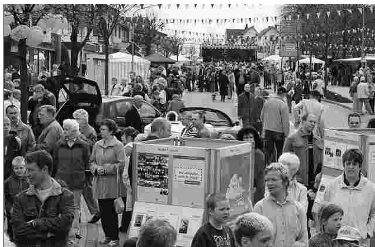
Das Simmerather Straßenfest heißt jetzt „Kraremann's Tag“, vereint aber wie bisher Volksfest-Charakter und sportliche Aktivitäten.

Anmelden (Startgeld für Kinder und Jugendliche 2 Euro, für Erwachsene 5 Euro) kann man sich auf der homepage: www.hansa-simmerath.de . Nachmeldungen werden auch noch bis eine Stunde vor Start des jeweiligen Laufes angenommen. (ale)