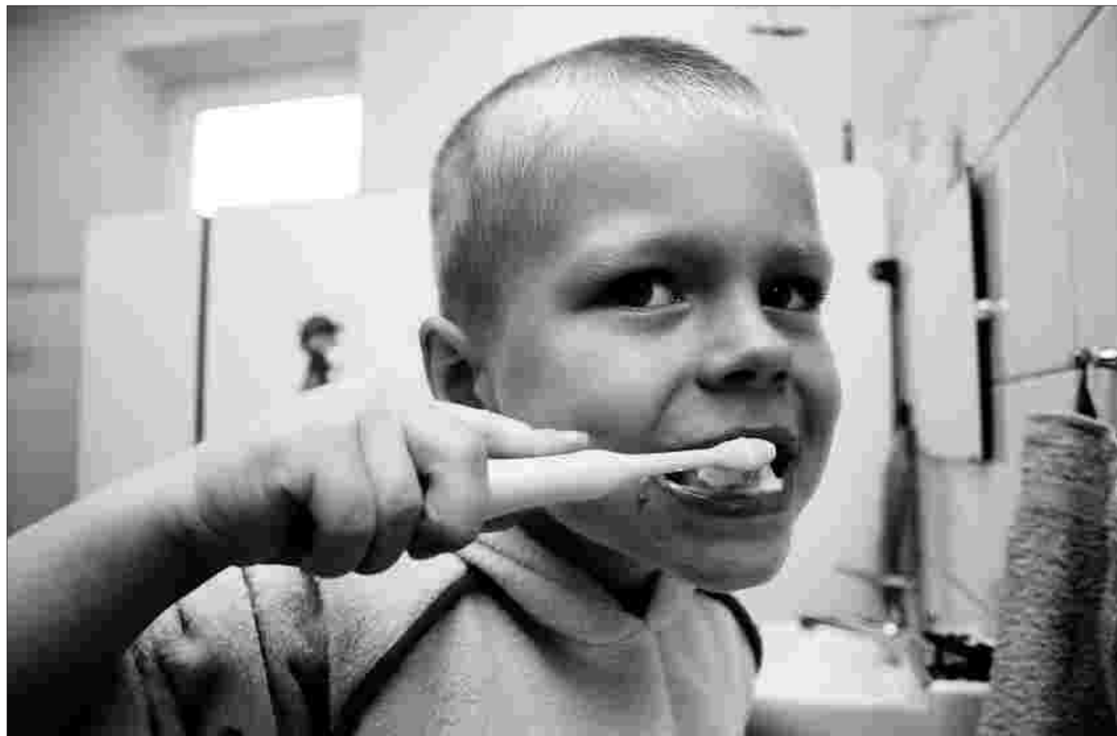
Richtig putzen für ein gesundes Gebiss: Drei von zehn Kindern bis zwölf Jahren im Kreis haben bereits Probleme mit ihren Zähnen.