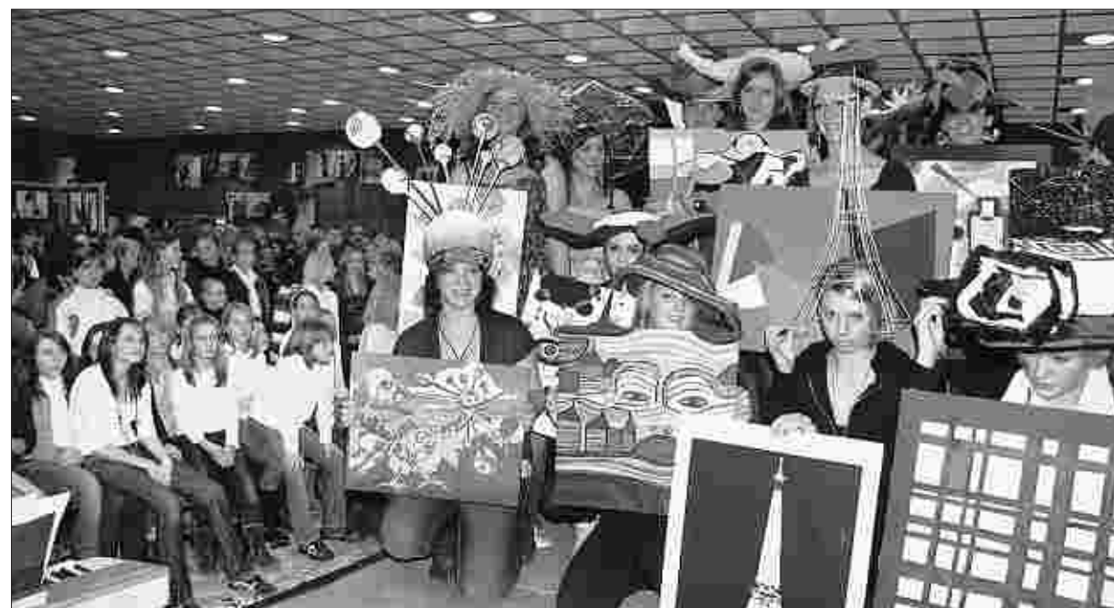
Eine Modenschau mit individuellen Hutkreationen, inspiriert durch Bilder bekannter Künstler, gehörte zum Rahmenprogramm bei der Eröffnung der Ausstellung „Mon Art - Meine Kunst“.

Die Ausstellung ist noch bis zum 15. Januar in der Sparkasse Monschau zu sehen. (ag)