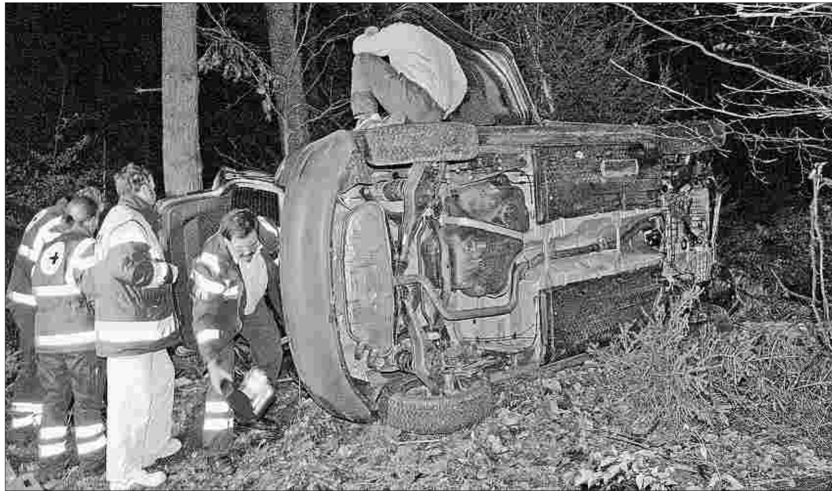
Der VW Golf fuhr geradeaus über eine Böschung hinweg den Wald bergab und prallte gegen einen Baum. Die Rettungskräfte mussten die Verletzten aus dem Fahrzeug bergen.

Der Sachschaden beträgt nach Polizeischätzung rund 24 000 Euro. Für die Zeit der recht schwierigen Bergung des Pkw musste die L160 für rund 30 Minuten voll gesperrt werden.