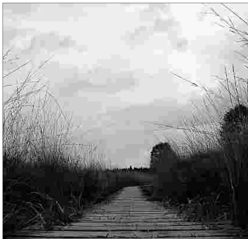
Viele Holzwege (Stege) führen durchs Hohe Venn und bringen die Wanderer sicher über die Moore.

SWR strahlt am Dienstagabend um 22 Uhr im Rahmen seiner Reihe „Fahr mal hin“ eine Folge über die Nordeifelandschaft aus.