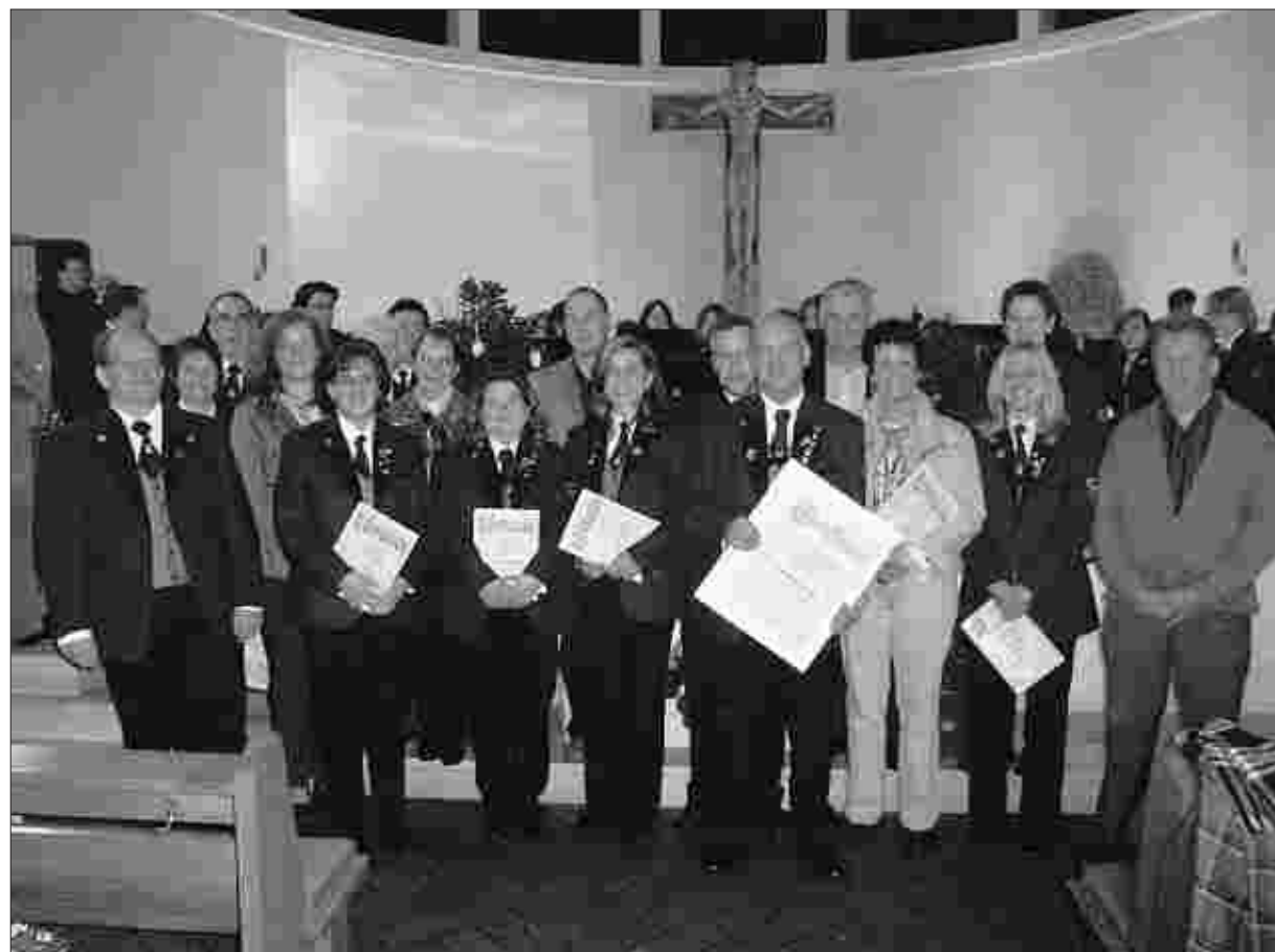
Im Rahmen des Frühjahrskonzertes des Musikvereins Harmonie Rollesbroich konnten vor imposantem Hintergrund viele Mitglieder des Vereins für ihre Treue zum Verein geehrt werden.

Auf die Wand hinter dem Altar wurden während der Stücke mit einem Beamer große Bilder projiziert, die zu den einzelnen Liedern passten. Mit Hilfe von Lampen, die rund um den Altarraum ange-