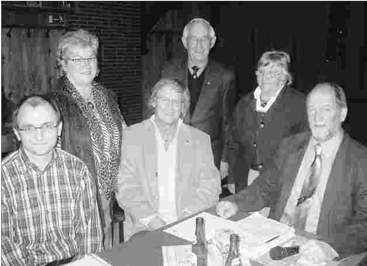
Freuen sich auf recht viele Impulse durch jugendlichen Nachwuchs: die Vorstandsmitglieder des Konzener Heimatvereins.

Zum überdies geplanten „Tag des Wanderns“ regten mehrere Sprecher an, die Kooperation mit anderen Ortsvereinen, etwa dem Eifelverein, zu suchen, um ein flexibles Netzwerk zu schaffen und damit organisatorische Kräfte zu bündeln. Bürgermeister Steinröx sagte für die Durchführung des sportlich-geselligen Naturerlebnisses die Hilfe der Stadt Monschau zu. (M.S.)