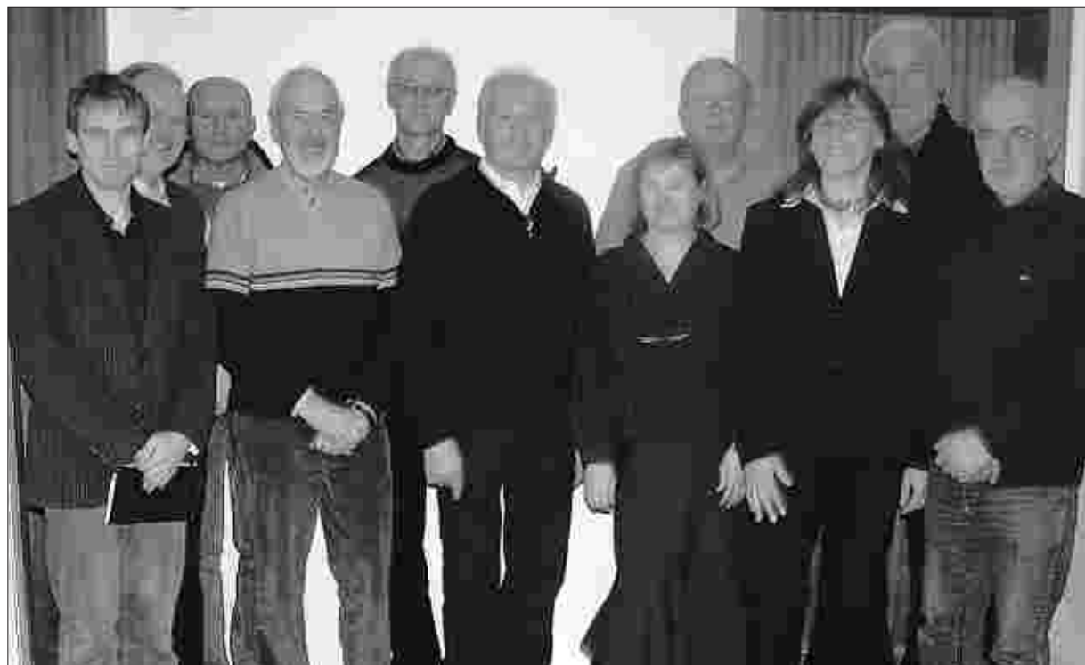
Der Roetgener Eifelverein wählte bei der Jahreshauptversammlung auch seine neue Vorstandsmannschaft.