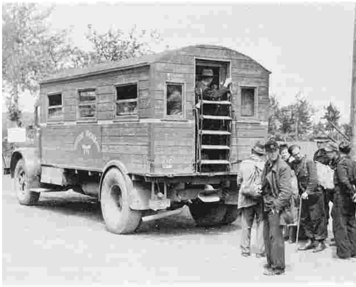
Aus dem alten Lastwagen wurde ein Omnibus: Dieser „Bus“ der Reichsbahn verkehrte im Jahr 1948 zwischen Aachen und Kalterherberg. In Konzen gab es nur eine Haltestelle oben an der „Bahn“.

Heute, 60 Jahre später, sind die Spuren längst beseitigt, die Dörfer sind so schön wie nie zuvor, sie wetteifern im Wettbewerb sogar um die beste Zukunft und um das schönste Dorf.