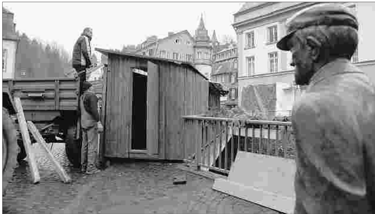
Die Budenstadt in der Altstadt ist vor den Augen von Maaßens Püelche verschwunden, 50 Häuschen von Richters Eck bis Aukloster haben vier Wochenenden lang überwiegend zufriedenstellende Geschäfte gemacht. An 18 Buden gab es Essen und Trinken, 15 Buden wurden in diesem Jahr von Einheimischen betrieben.