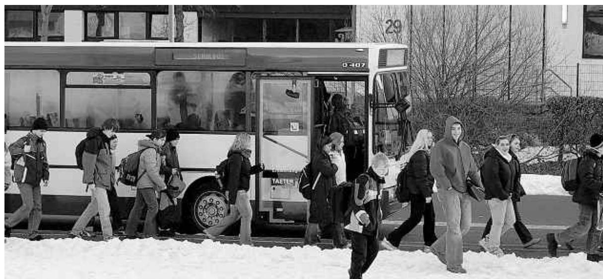
Für die Schüler werden die Wartezeiten kürzer. Zur Hauptschule nach Simmerath wird künftig ein weiterer Bus eingesetzt.